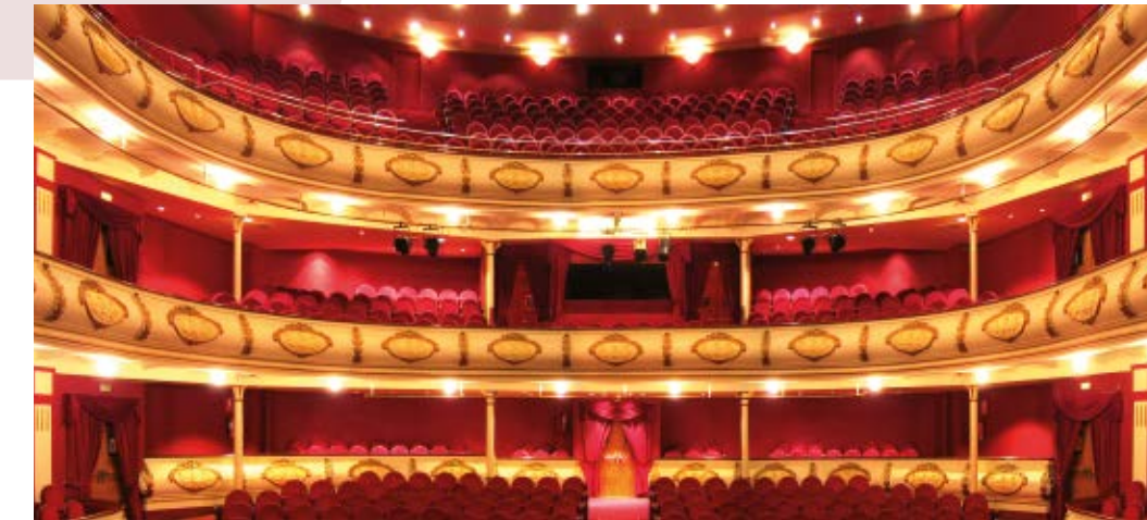
Vista del interior de la sala del Teatro Chapí en la actualidad

El Teatro Chapí está considerado como uno de los teatros más relevantes de la Comunidad Valenciana, e incluso en el ámbito nacional gracias a sus características escénicas y de aforo que le permiten acoger espectáculos de primer nivel. El Teatro Chapí pertenece a la Red Española de Teatros, Auditorios y Festivales de Titularidad Pública.