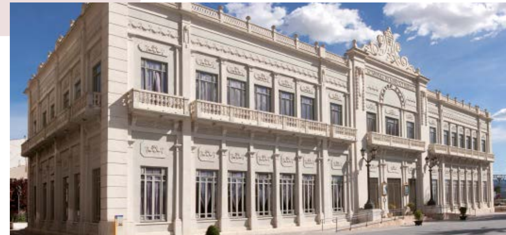
Fachada actual Teatro Chapí, arquitectos Garín Hermanos, 1925

Hasta la fecha, el Teatro Chapí, acoge gran variedad de espectáculos teatrales, musicales, conciertos, ballet, ópera, zarzuela, etc. a lo largo de sus dos temporadas anuales.