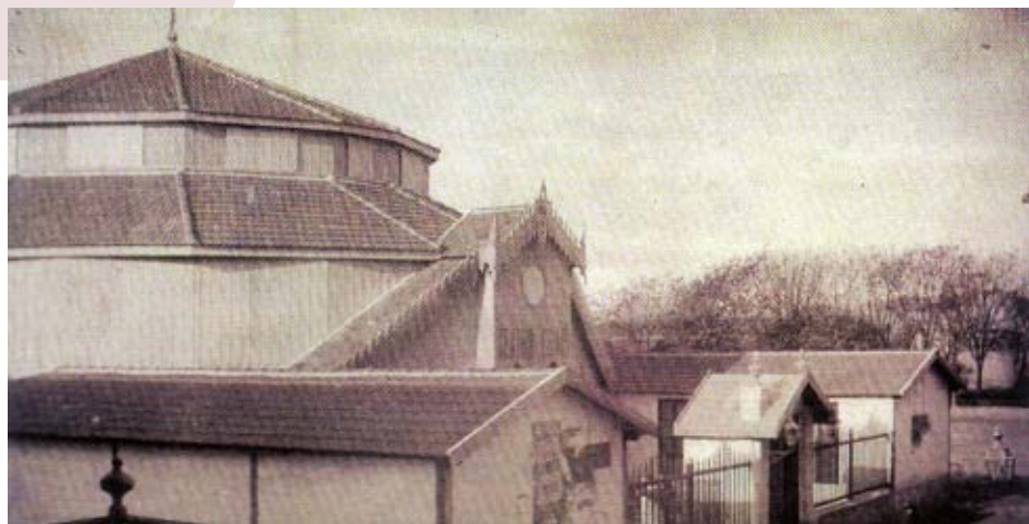
Teatro Circo (1885-1908)

El proyecto, que contó con la aprobación y el respaldo del Ayuntamiento, se vio culminado el 20 de junio de 1885, inaugurándose con la zarzuela “La Tempestad” que fue dirigida por el propio compositor. Durante 23 años de funcionamiento desarrolló una ambiciosa programación, pero las insuficientes medidas de seguridad del edificio obligaron a su derribo el 14 de julio de 1908.