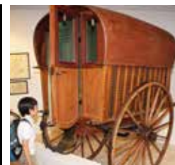
D21. Tartana. Finales s. XIX.