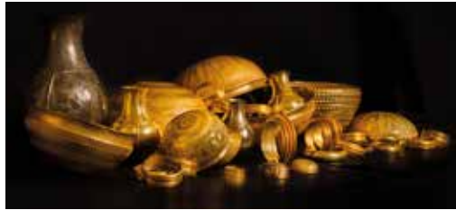
C6. Tesoro de Villena. Edad del Bronce. 1300-1000 a. C.