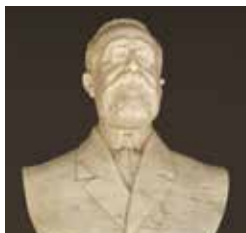
B13. Busto de Ruperto Chapí. Francisco Cerdán. 1919.