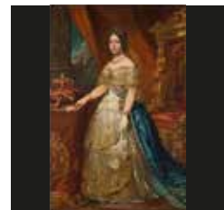
D16. Retrato de Isabel II. Óleo sobre lienzo. Circa 1844.