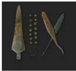
B3. Ajuar funerario. Cueva Oriental del Peñón de la Zorra. Campaniforme.