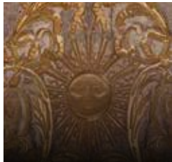
B11. Manto del Sol. Virgen de las Virtudes. Siglos XVII-XVIII.