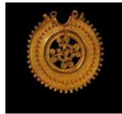
B7. Arracada de la Condomina. Cultura ibérica. Siglo VI a. C.