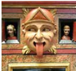
B12. Reloj de sala tipo "Orejón". Medios del s. XVIII.