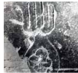
B9. Mano de Fátima. Castillo de la Atalaya. Siglo XIV.