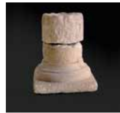
B8. Basa de columna romana. Candela. Siglos I a.C.-V d.-C.