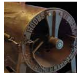
D19. Estrujadora-desrapadora de vino. Siglo XIX.