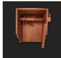
D18. Clepsidra. Principios del siglo XX.