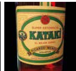
D20. Licor Katakí. Circa 1950.