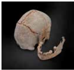
B1. Cráneo y maxilar inferior. Hueso / Casa Corona. Mesolítico, hace 8.000 años.