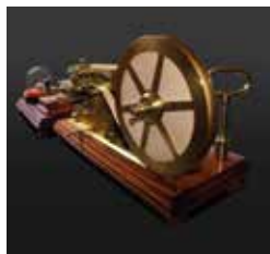
D15. Telégrafo morse del Chicharra. Fin s. XIX.