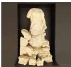
B14. Escultura de la I República española. 1873.