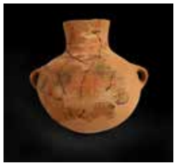
B2. Cántaro decorado. Cerámica. Arenal de la Virgen. Neolítico.