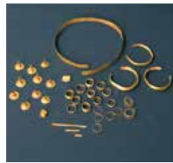
B5. Tesorillo del Cabezudo Redondo. Edad del Bronce.